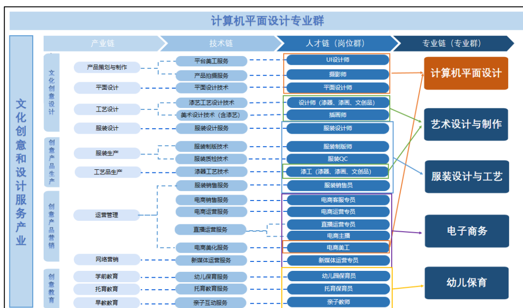
图 1 计算机平面设计专业群组群逻辑

计算机平面设计专业群以“艺术设计+文化创意”为组群思路，以商业、文化、生活对于艺术设计、文化教育的需求等为依据，对接粤港澳大湾区文化创意和设计服务产业。文化创意和设计服务产业，包括文化创意设计产业链、创意产品生产产业链、创意产品营销产业链和创意教育产业链，其中，文化创意设计产业链涵盖产品策划与制作、服装设计、平面设计、室内设计、工艺设计等环节，创意产品生产产业链涵盖服装生产、工艺品生产等环节；创意产品营销产业链涵盖市场调研、网络营销、产品推广、运营管理等环节，创意教育产业链涵盖托育教育、早教教育、幼儿保育、少儿教育等环节。