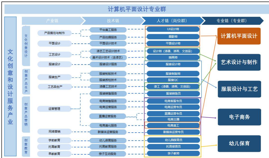
图 1 计算机平面设计专业群组群逻辑

计算机平面设计专业群以“艺术设计+文化创意”为组群思路，以商业、文化、生活对于艺术设计、文化教育的需求等为依据，对接粤港澳大湾区文化创意和设计服务产业。文化创意和设计服务产业，包括文化创意设计产业链、创意产品生产产业链、创意产品营销产业链和创意教育产业链，其中，文化创意设计产业链涵盖产品策划与制作、服装设计、平面设计、室内设计、工艺设计等环节，创意产品生产产业链涵盖服装生产、工艺品生产等环节；创意产品营销产业链涵盖市场调研、网络营销、产品