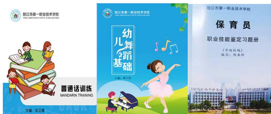
校本教材和试题集