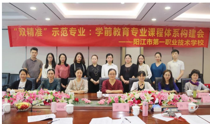
课程体系构建研讨会