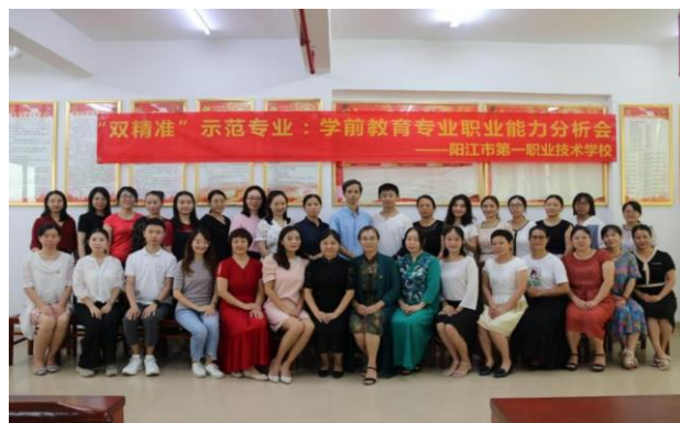
专业职业能力分析研讨会

通过召开职业能力分析实践专家研讨会，经过多维度的分析与梳理，运用“二维四步五解”的职业能力分析方法，最终形成了包括 27 个工作项目/职业素养、92 项工作任务、458 条职业能力的学前教育专业职业能力分析表。