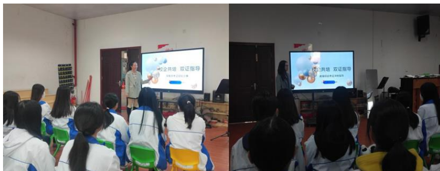
幼儿园教师给专业学生上“双证课”

为了提高双证书通过率，在辅导学生考证之前与幼儿园固定教师共同研讨制定指导计划，然后在辅导中期邀请幼儿园老师到校与学生面对面分享指导，此举初见成效，2019 年学生获取证书的通过率均比以往有所提升，但在 2020 年通过率又有所回落，我们仍然还需要探索更多的有效方法提高学生的考证通过率。